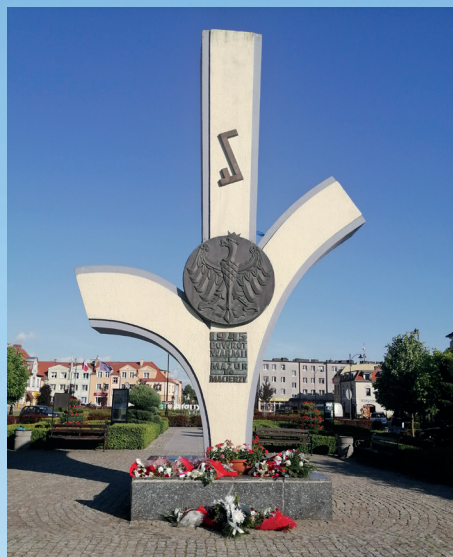
Pomnik Pamięci Narodowej w Biskupcu

Olsztyn, 16 października 2022 r. (niedziela)