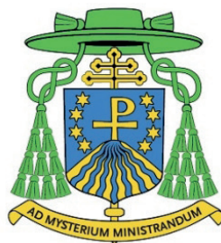
Abp Józef Górzyński Metropolita Warmiński