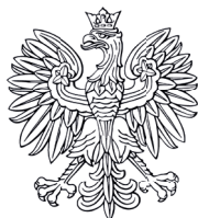
WOJEWODA WARMIŃSKO-MAZURSKI Artur Chojecki